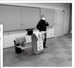
活動風景 コロナ対策も万全に、