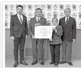
「介護予防サポーターズ」 市長訪問