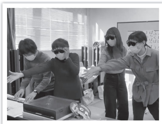
ボランティア活動撮影中

令和3年度からはオンラインによるつながりを充実、地域へ拡大していくことを目的として、大阪府福祉基金地域振興助成金を活用した事業「つながれオンラインArea」の取り組みを始めています。新たな情報発信の拠点として、「ほのぼのかたしも」のオンライン環境を充実させました。ボランティアが遠隔訪問するリモート・ボランティア「リモボラ」などの取り組みをはじめています。