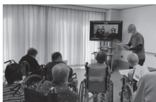
コロナ禍での新たなコミュニケーションの形

新型コロナウイルスの影響が長期化する中、活動の自粛、施設の休館、休業などにより様々な地域福祉活動は中止に追い込まれ、見守り訪問やサロンなど地域とのつながりは減少していきました。柏原市社会福祉協議会では、地域福祉活動を再開させるため、令和2年度より「つながれオンライン（リモート機器貸出）事業」として、インターネット環境の無かった地域や団体にリモート機器を貸し出し、オンラインを介してコミュニケーションをはかる取り組みを始めました。ICTを活用したオンラインでの「つながり」は非接触によるコロナ禍の感染予防対策にも役立てることができました。