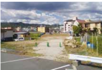
●田辺旭ヶ丘線整備予定地

本市が抱える人口減少等の地域課題克服のため、まちの利便性向上や良好な住環境の形成を目標に掲げており、スマートIC設置事業は、その軸を担う主要な事業ととらえている。今後、事業化に向けた準備を着実に進め、国への要望活動にも積極的に取り組んでいきたい。 要望 財源の確保については、会派としても引き続き国への要望活動に協力していくので、市としても幹線道路ネットワーク整備に向けて、近隣自治体と協力しながら、取組を進めるよう要望する。